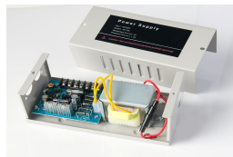
Fuente 12V 5A