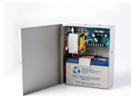
Fuente 12V 5A con batería