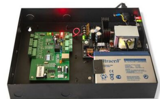
Gabinete c/fuente 12V 5A para controladora c/batería