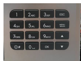
Teclado tipo T9