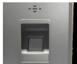
Lector de Huellas con sensor DSP